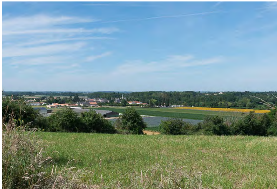
Paysage de Saint-Martin-de-Sanzay depuis le Puy de Mont